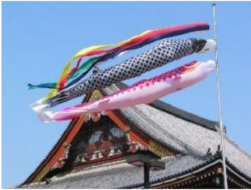
高高掛起鯉魚旗象徵孩子將來鯉魚跳龍門